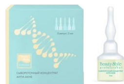
СЫВОРОТОЧНЫЙ КОНЦЕНТРАТ АНТИ-АКНЕ "STOP ACNE"