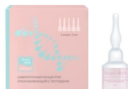
СЫВОРОТОЧНЫЙ ОМОЛАЖИВАЮЩИЙ КОНЦЕНТРАТ "SUPERLIFT PEPTIDE"