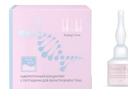
СЫВОРОТОЧНЫЙ КОНЦЕНТРАТ С ПЕПТИДАМИ ДЛЯ ОБЛАСТИ ВОКРУГ ГЛАЗ "SUPERLIFT"