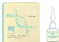
СЫВОРОТОЧНЫЙ КОНЦЕНТРАТ УСПОКАИВАЮЩИЙ "ANTI COUPEROSE"