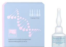
СЫВОРОТОЧНЫЙ КОНЦЕНТРАТ УВЛАЖНЯЮЩИЙ 24 ЧАСА "HYDRO BALANCE"