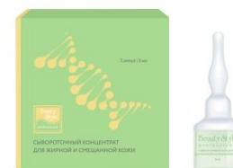
СЫВОРОТОЧНЫЙ КОНЦЕНТРАТ ДЛЯ ЖИРНОЙ И СМЕШАННОЙ КОЖИ "SEBO BALANCE"