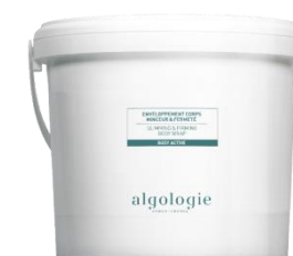
ОБЕРТЫВАНИЕ ДЛЯ ТЕЛА «ПОХУДЕНИЕ И ПОДТЯЖКА»