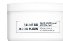
ПИТАТЕЛЬНЫЙ БАЛЬЗАМ ДЛЯ ТЕЛА «МОРСКОЙ САД»