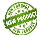
МАЦЕРАТ ЭФИРНЫХ МАСЕЛ ДЛЯ УМЕНЬШЕНИЯ ОБЪЕМОВ «МОРСКОЙ САД»