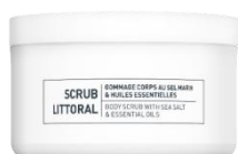
ЛИТТОРАЛЬНЫЙ СКРАБ ДЛЯ ТЕЛА С МОРСКОЙ СОЛЬЮ