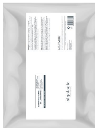
Омолаживающая укрепляющая маска из биоцеллюлозы Арт. 23CNA704 – упаковка 5 саше