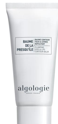
Бальзам с эффектом филлера для глаз и губ Арт. 23CNA702 – 50 мл