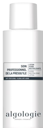
Увлажняющий лосьон нейтрализатор Арт. 23CNA706 - 100 мл