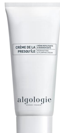
Укрепляющий крем с эффектом филлера Арт. 23CNA701 – 100 мл