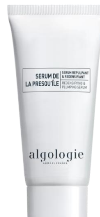
Укрепляющая сыворотка с эффектом филлера Арт. 23CNA700 - 50 мл