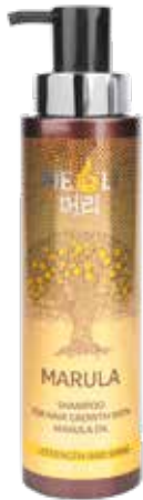
ШАМПУНЬ ДЛЯ РОСТА ВОЛОС С МАСЛОМ МАРУЛЫ «СИЛА И БЛЕСК»