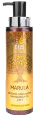
МАСКА ДЛЯ РОСТА ВОЛОС С МАСЛОМ МАРУЛЫ 2 В 1 «СИЛА И БЛЕСК»