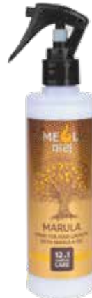
СПРЕЙ ДЛЯ РОСТА ВОЛОС С МАСЛОМ МАРУЛЫ КОМПЛЕКСНЫЙ УХОД 12 В 1