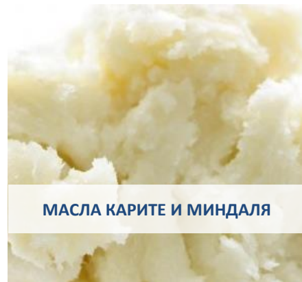
МАСЛА КАРИТЕ И МИНДАЛЯ