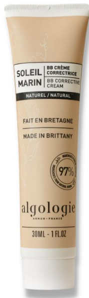
23VNA900 - 30 мл НАТУРАЛЬНЫЙ ТОН

ФОРМУЛА ДЛЯ 100% КРАСОТЫ И СИЯЮЩЕГО ЦВЕТА ЛИЦА КРУГЛЫЙ ГОД. ИДЕАЛЬНОЕ СОЧЕТАНИЕ УХОДА ЗА КОЖЕЙ И МАКИЯЖА ДЛЯ УЛЬТРА-ЕСТЕСТВЕННОГО ЦВЕТА ЛИЦА И РОВНОГО ТОНА КОЖИ.