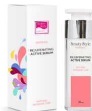
СЫВОРОТКА С МАТРИКСИЛОМ

4515866AR – 120 мл 4505866APROR – 300 мл