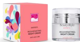
НОЧНОЙ КРЕМ С МАТРИКСИЛОМ