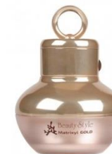
ОМОЛАЖИВАЮЩИЙ КРЕМ «МАТРИКСИЛ GOLD»