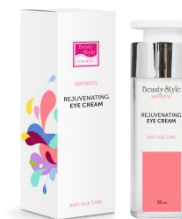
КРЕМ ВОКРУГ ГЛАЗ С МАТРИКСИЛОМ